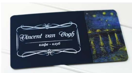
Визитная карточка, отпечатанная на принтере OKI Pro9541