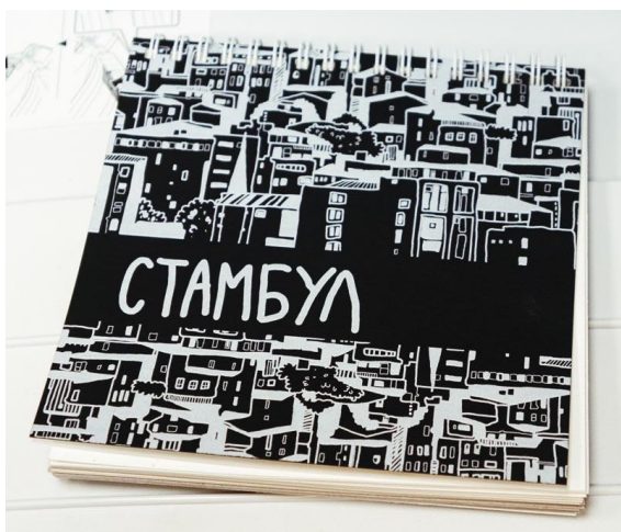
Рисунок на обложке этого блокнота напечатан белым тонером на принтере OKI Pro9541

В апреле текущего года принтер OKI Pro9541 был приобретен в качестве второго печатающего устройства для выполнения задач, с которыми не способен справиться основной аппарат. Одна из них — печать изображений на темных и цветных материалах. Это могут быть как надписи и монохромные рисунки белого цвета, так и полноцветные изображения на белой подложке.