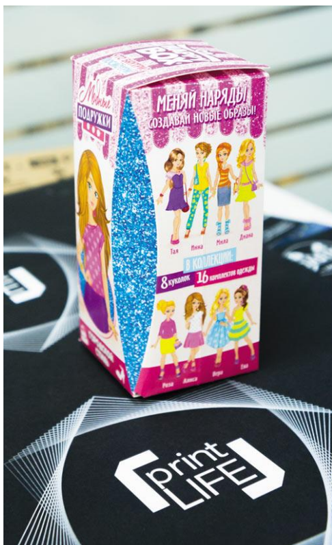
Образец розничной упаковки, отпечатанный на принтере OKI Pro9541