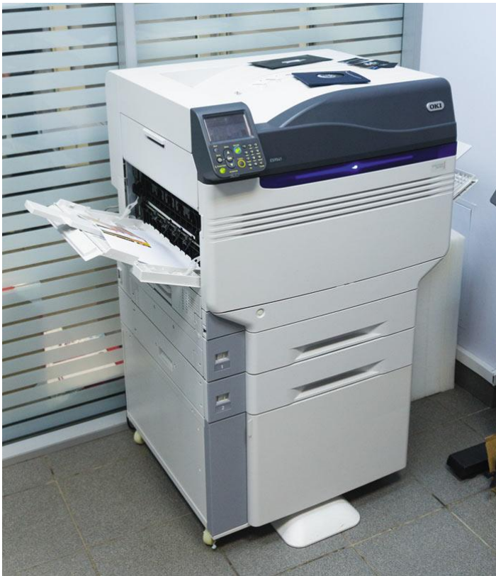
Принтер OKI Pro9541 в помещении салона оперативной полиграфии Print Life

Максимальная скорость печати OKI Pro9541 составляет 28 и 50 стр./мин на носителях форматов А3 и А4 соответственно как в монохромном режиме, так и в цвете (в четыре краски). Время выхода первой страницы после запуска задания — всего 8 с. Рекомендуемая нагрузка составляет 25 тыс. страниц в месяц, максимальная — 300 тыс.