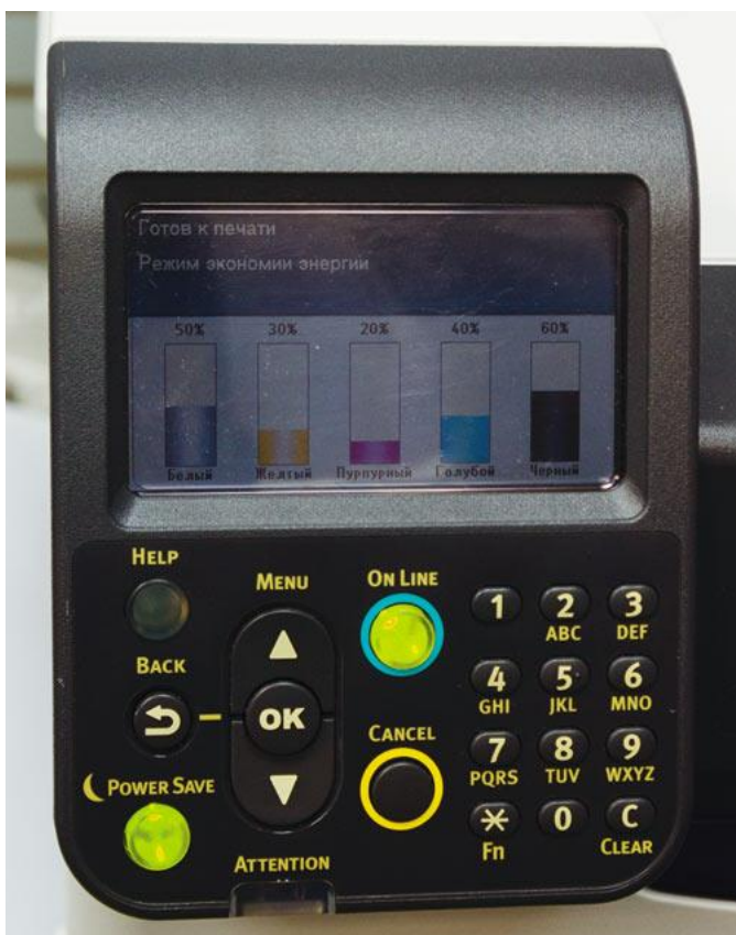
Панель управления принтером OKI Pro9541

При необходимости данную модель можно дооснастить одним или двумя дополнительными лотками автоматической подачи, каждый из которых вмещает по 530 листов, либо модулем податчика повышенной емкости на 1590 листов. Это позволит увеличить суммарный запас бумаги до 2950 листов. Кроме того, доступны для приобретения дополнительный лоток для бумаги (на колесиках), лоток для баннеров и напольная подставка.